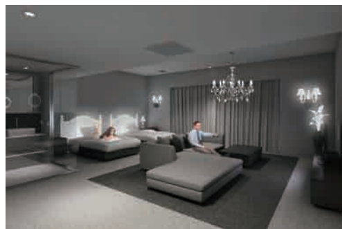
ビジネススイート “光の部屋”