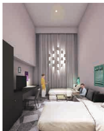
スーベリアツイン “光るカーテンの部屋”