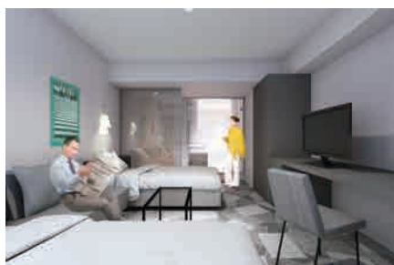
プレミアツイン/プレミアダブル “ポスターの部屋”