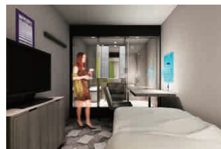
シングルルーム “ポスターの部屋”