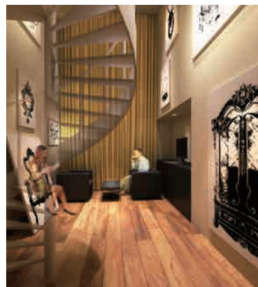
フェミニンスイート “キャンパスの部屋”