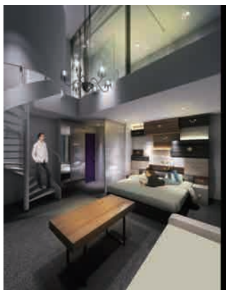
ペントハウススイート “引き出しの部屋”