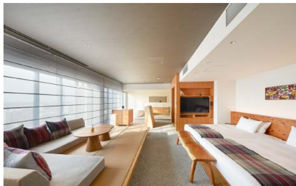
ストレータスイート