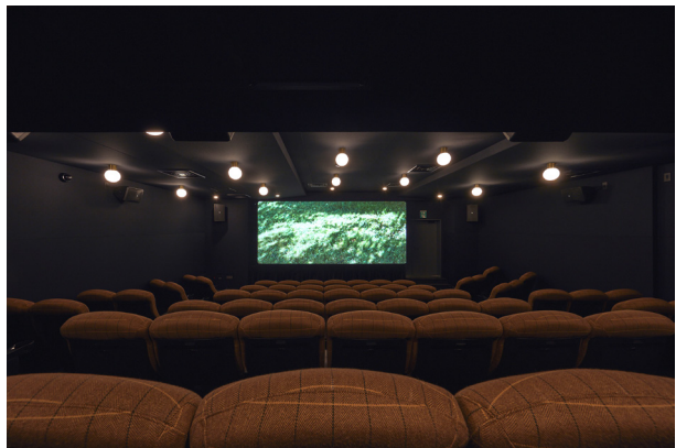
「K2」は映画館が立つ場所「北沢 2 丁目」と、世界最高峰の山「K2」を重ね合わせた名称 (写真左: チケット購入カウンター、右: シアター内)