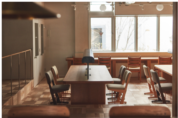
図書館をイメージした3階ラウンジ。仕事や読書などに

「(tefu) lounge by KITASANDO COFFEE」は完全キャッシュレスカフェ「KITASANDO COFFEE」「TAILORED CAFE」を展開するカンカクが運営。専用モバイルアプリ『COFFEE App』に新たに加わるラウンジ機能により、空席状況を踏まえたスペース予約から、ドリンクやフードの事前注文・決済まで、ワンストップでご利用いただけます。