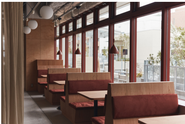
喫茶店をイメージした2階ラウンジ。1人でも、友人との語らいにも。

ソファやデスク、シェアテーブル、ブースなど多様なスペースから利用者が用途や気分に合わせて席を予約して、1時間 750円(税込)から自由に利用できます。利用時間中は自家焙煎のスペシャルティコーヒーを含むドリンクを好きなだけお楽しみいただけます、(tefu) セレクトの家具を配置した落ち着いた雰囲気の中で、想い通りの時間を過ごしていただけます。