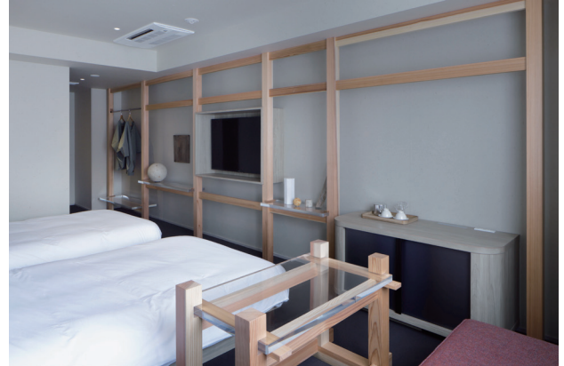
(左)4名までゆったりとくつろげるグループツイン